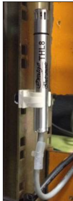
01088. Clip de sujeción de nylon