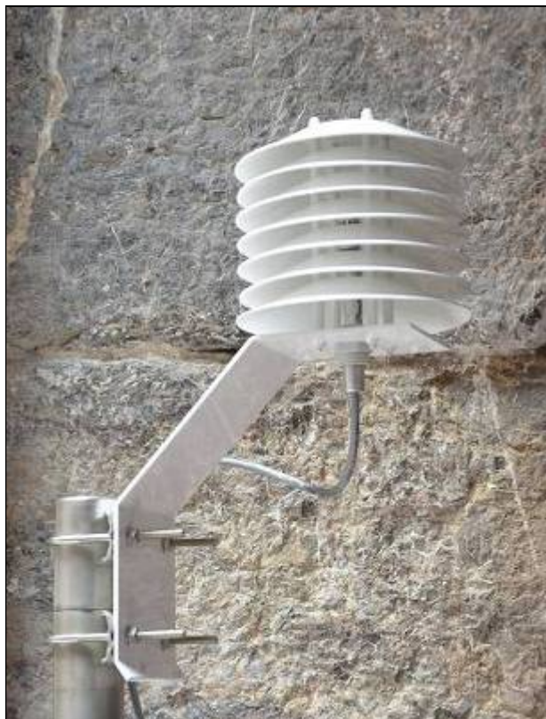
PSG-7. Aísla el sensor de temperatura y humedad de la radiación solar y de otras fuentes de calor irradiado y reflejado.